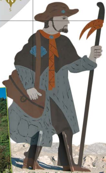
Silhouette d'un pèlerin à Jongieux