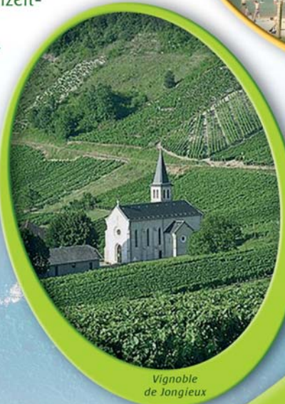
Vignoble de Jongieux