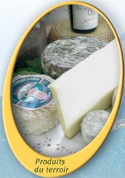
Produits du terroir

conception et impression REPROLAC 04 79 25 23 31