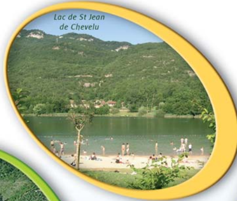
Lac de St Jean de Chevelu