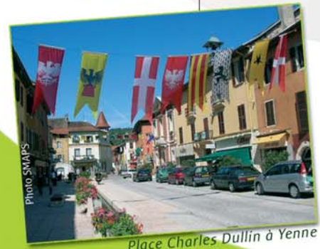
Place Charles Dullin à Yenne