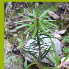
PNR des Bauges

Ne pas planter d'essences exotiques notamment résineuses.