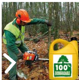
PNR des Bauges

→ Utiliser des huiles biodégradables. Privilégier les techniques de compostage ou broyage à celle du brûlage.